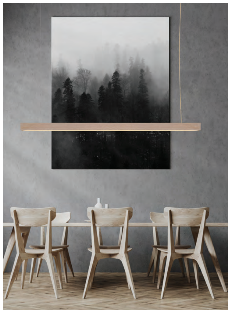
Mit ihren geraden Linien ergänzt die Hängeleuchte aus Eichenholz das minimalistische Esszimmer perfekt. Hier zu sehen: „The Oak“ der Serie L.

Perfektes Licht, ob privat für Esszimmer, Küche oder Home Office, im Betrieb für das Großraumbüro, oder den Bildschirmarbeitsplatz, das ist das Ziel von Christian Dohnal. Um all diese Bereiche abdecken zu können wurden 5 Leuchtenserien mit unterschiedlichen Merkmalen entwickelt. Von den Ultra-Slim Hängeleuchten der Serie xS bis zu den direkt-/indirekt strahlenden Leuchten der Serie L. Für den kleinen Schreibtisch im Home Office empfiehlt sich die Serie xS, für das Esszimmer die Serie S mit warmweißem Licht und satiniertes Optik. Der Schreibtisch im Büro könnte mit Serie L in neutralweiß und mikroprismatischer Optik perfekt beleuchtet werden. xS-Aura mit einzigartiger Lichtaura, Serie M als Alleskönner. Christian Dohnal liebt es modern, einfach, und komfortabel. Daher sind alle Leuchten in dimmbaren Ausführungen erhältlich, denn damit ist auch eine Anbindung an moderne Steuerungssysteme möglich. Die Option der Steuerung über Handy und Tablet sieht der Technikfreak als ein absolutes Highlight der Leuchten.